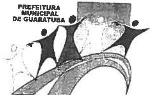
TABELA C - INDUSTRIAL